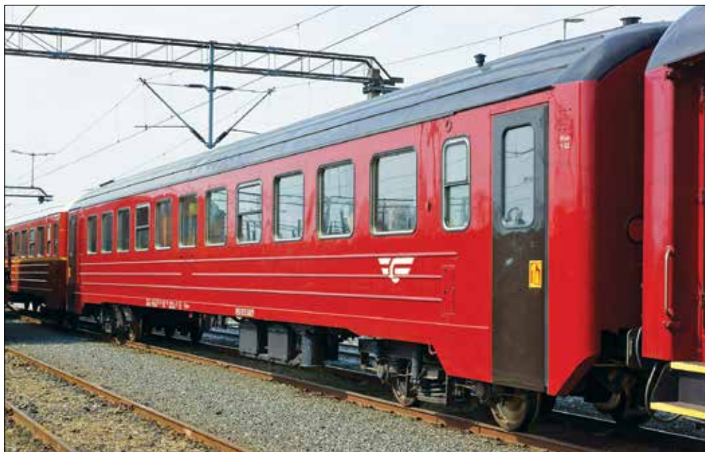
BF14 21728 (øverst) og BC5 26029 (til venstre) har som de andre vognene i Stålvogntoget en del vinduer som må byttes.