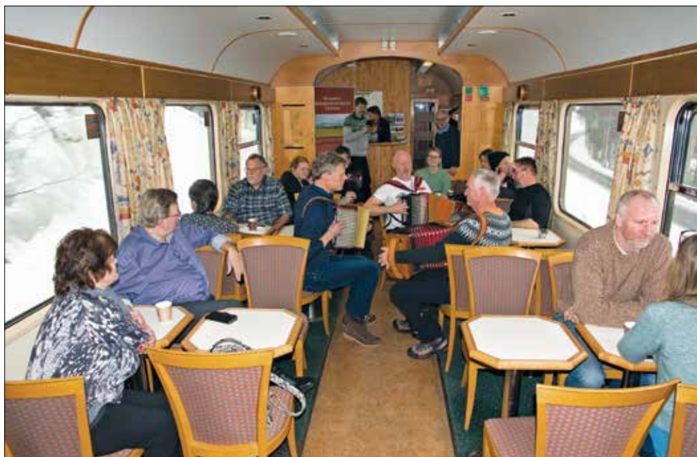
Det var et fullsatt tog til Røros-martnan. I bistrovogna ble det god stemning når flere trekkspill dro i gang.